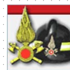
Vigili del Fuoco della Spezia